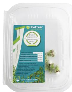
Botão Floral RiaFresh®