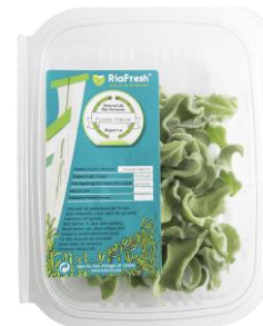
Ficoide Glacial RiaFresh®