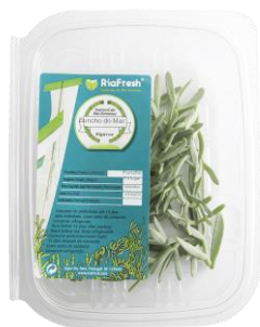
Funcho Marinho RiaFresh®

Fundo Europeu de Desenvolvimento Regional