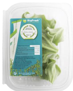
Alfaca Glacial RiaFresh®