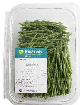
Salicórnica RiaFresh® para Canal Horeca