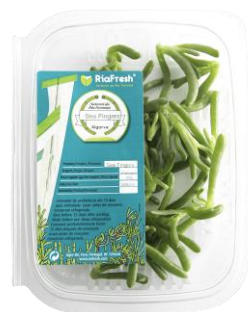
Sea Fingers RiaFresh®