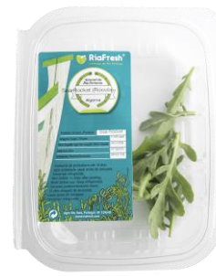
Rucula Marinha RiaFresh®