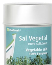
Sal Vegetal RiaFresh®